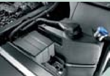
Módulo de dosificación